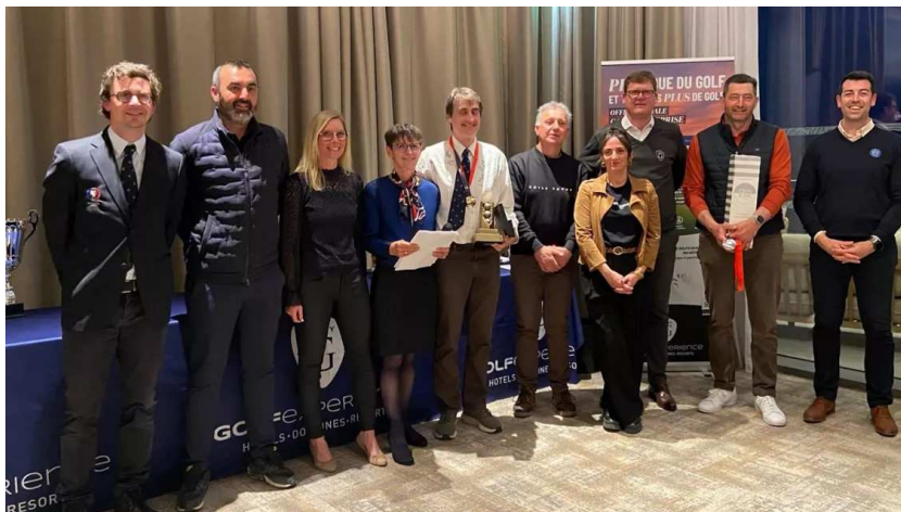
Les vainqueurs 2025

Samedi 21 mars au Golf de La Prée La Rochelle (17)