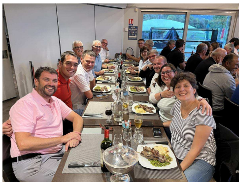
L'équipe de Bretagne 2025

Les 29 et 30 août sur le golf de Strasbourg (67)